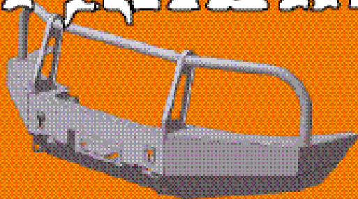
Телефон: 8 (926) 773-43-43

Московская обл., Орехово-Зуево, Лапина, 58а интернет-магазин, доставка 8 (926) 773-43-43