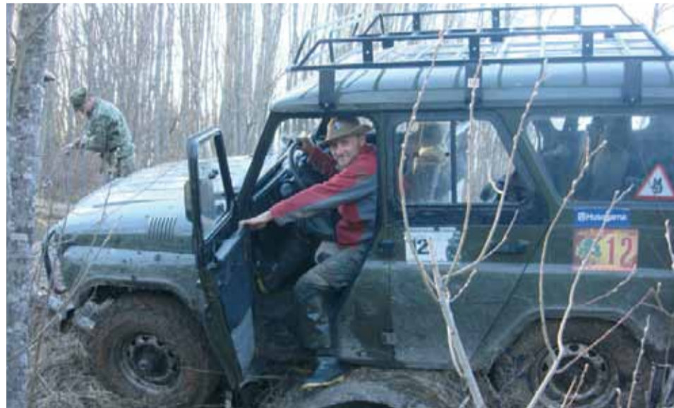
Экспедиционный багажник — необходимый аксессуар любого путешественника

У: Для каких машин выпускает силовые обвесы ваше предприятие? Что вы предлагаете для владельцев УАЗов? В чем преимущество вашей продукции по сравнению с другими производителями?