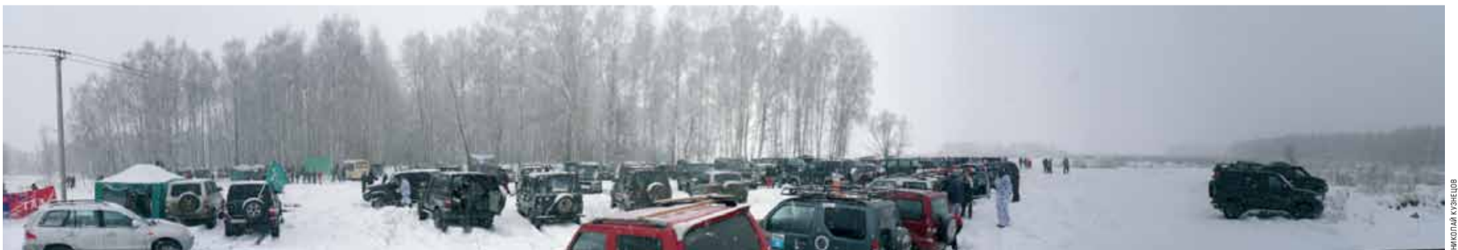
В этом году «Снежный десант» собрал более 70 экипажей.

В феврале этого года Клуб УАЗ Патриот вновь собрал сотни поклонников внедорожных приключений на свою традиционную зимнюю гонку «Снежный Десант 2009». Всего на старт этого увлекательного соревнования вышли более семидесяти экипажей из Москвы, Подмоскovie, Рязани и Тулы. В свойственной им манере организаторы этого мероприятия предложили участникам не только интересную со спортивной точки зрения линейную гонку, в которой экипажи следуют по строго определенному маршруту, пользуясь выданными им на старте дорожными книжками, но и сочинили для участников целую легенду гонки, умело связав ее с общим военно-патриотическим характером мероприятия с одной стороны и политическими реалиями современного мира - с другой. Так, помимо прохождения трассы, участникам соревнований по легенде требовалось выполнить приказ главнокомандующего и обезвредить диверсионную группу, высадившуюся в районе проведения соревнования, и восстановить тем самым прерванное газоснабжение.