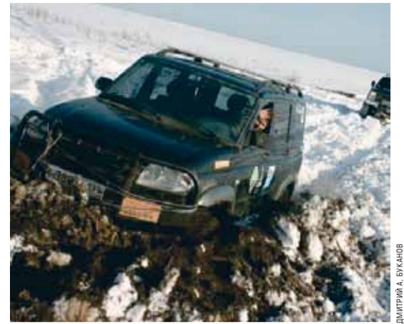
ДМИТРИЙ А. БУКАЛОВ

ДВ: Всё зависит от силы воздействия — если это относительно несильный удар, то с силовым обойдётся без последствий, штатный же может разрушиться. Кто видел штатные кронштейны крепления бампера поймет, что они погнут-