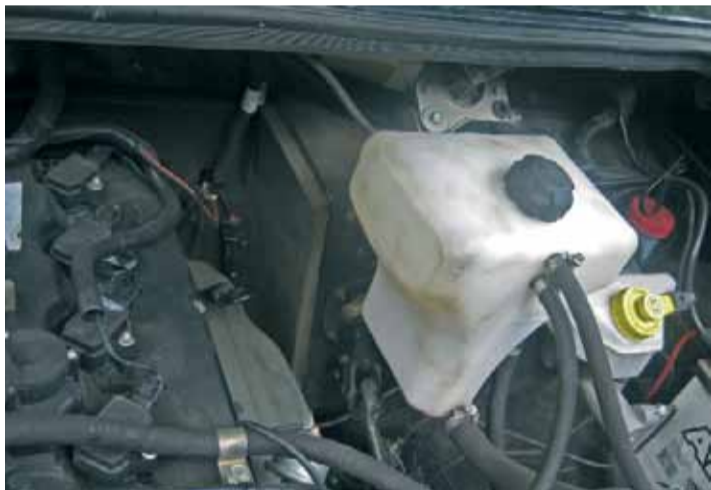
Выдвинутый в моторный отсек педальный щит легко размещается слева от узкого рядного двигателя и позволяет экономить продольный габарит салона.

А почему собственно отечественный? Потому что цена нового Патриота в разы меньше, чем у его иностранных аналогов. Кроме того, надо учитывать еще пока низкие цены на запчасти, а так же их доступность и возможность обслуживания на всей территории страны. Почему не бывший в употреблении, сходный Патриоту по цене иностранный аналог? Потому что у такого остаточный ресурс уже гораздо меньше, чем у нового УАЗа, а ремонт дорогой. По крайней мере в Москве Land Cruiser или Patrol за эту цену в живом состоянии найти крайне сложно.